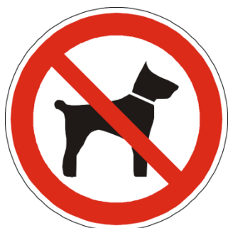
Slika 3: Oznaka zabrane prisustva pasa.

Najsigurnija zaštita od prisustva pasa na dečijim igralištima je ograđivanje i postavljanje tabli zabrane prisustva pasa namenjenih vlasnicima. Ova rešenja treba praktikovati naročito u visoko urbanim delovima grada gde postoji velika gustina stanovništva a nedostatak slobodnih površina.