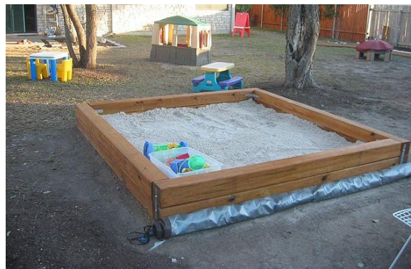
Slika 4. Peščanik sa zaštitnom mrežom.

U pesku sa teško primećuje prisustvo izmeta koji psi i mačke instiktivno zatrpavaju, tako da peščanici predstavljaju pravi izvor zaraze. Opasnost postoji čak i na peščanisima koji se nalaze u sklopu vrtića, gde je pristup ograničen, zbog činjenice da ni jedan peščanik ne poseduje zaštitnu mrežu koja se postavlja nakon završetka igre a naročito noću.