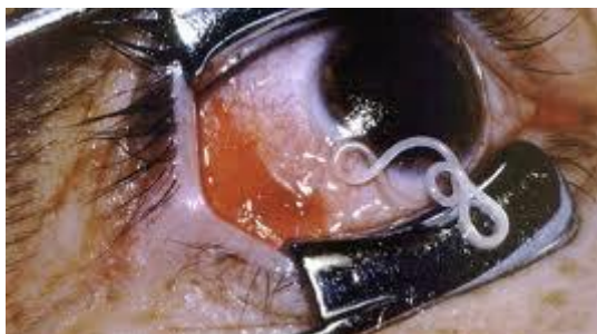
Slika 2. Parazitski crv Toxocar canis .